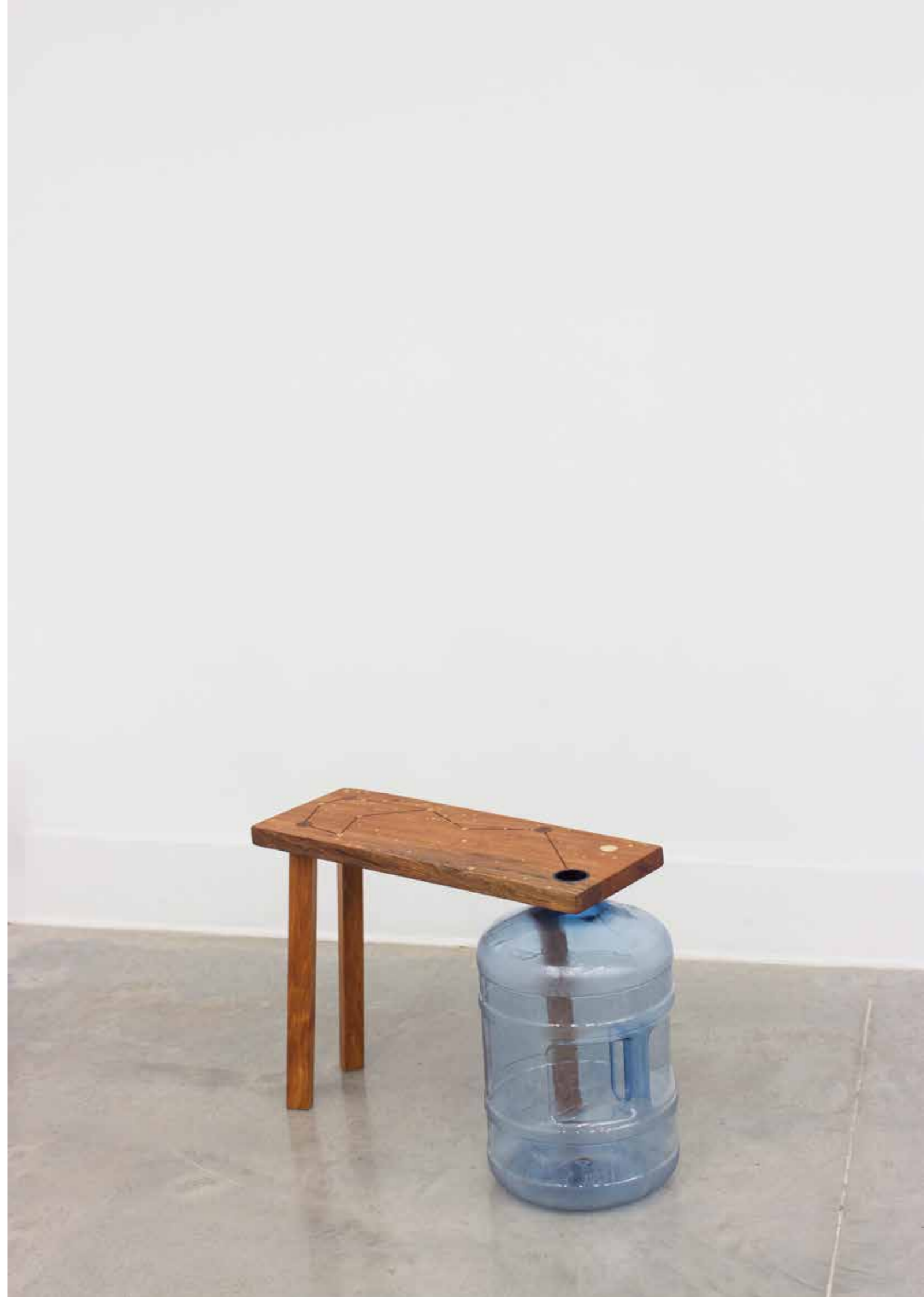
Carina — 2021-2022 Madera y objetos incrustados 45x60x23 cm