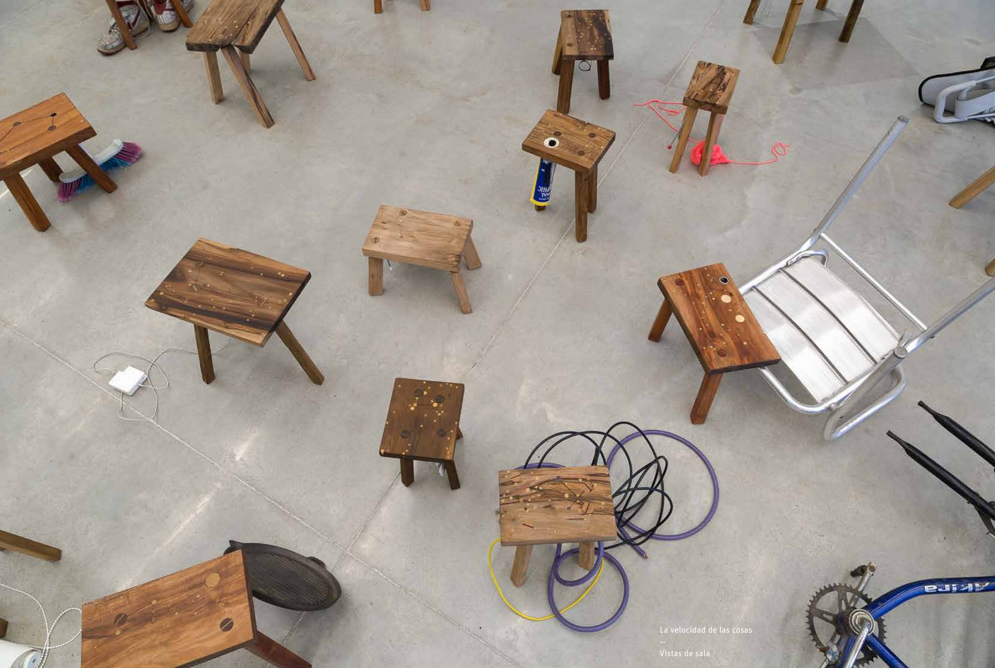
La velocidad de las cosas — Vistas de sala