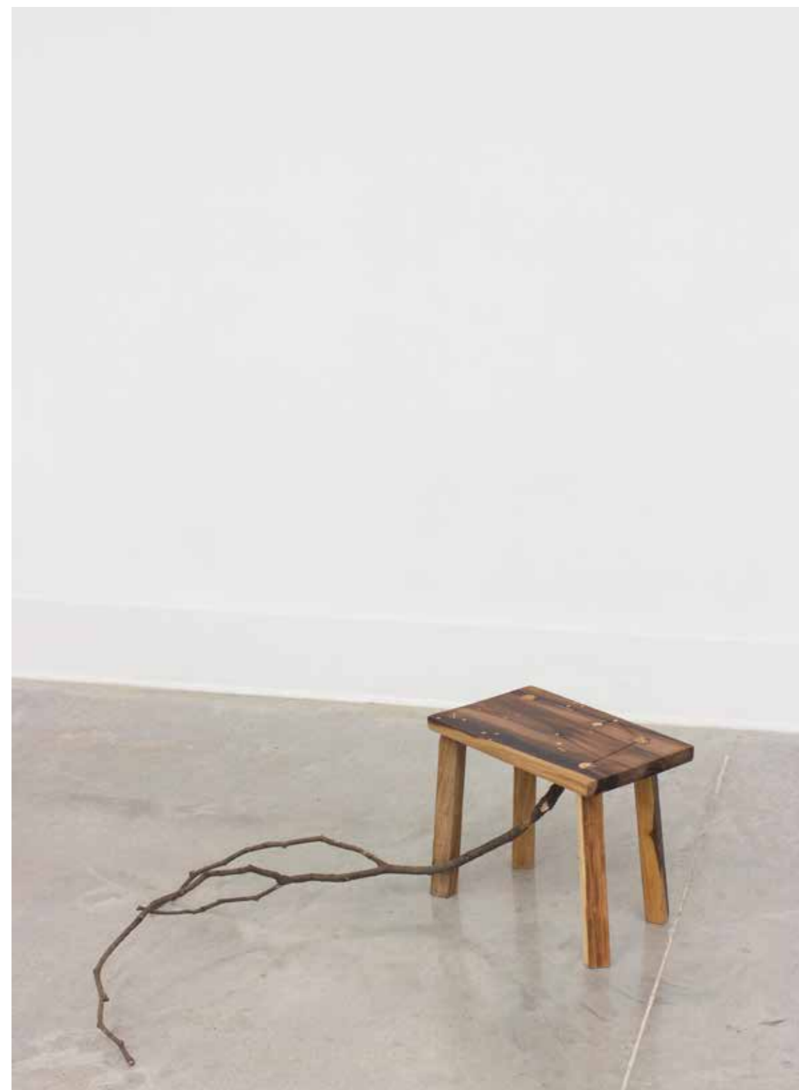
Sextans — 2021-2022 Madera y objetos incrustados 30x38x80 cm