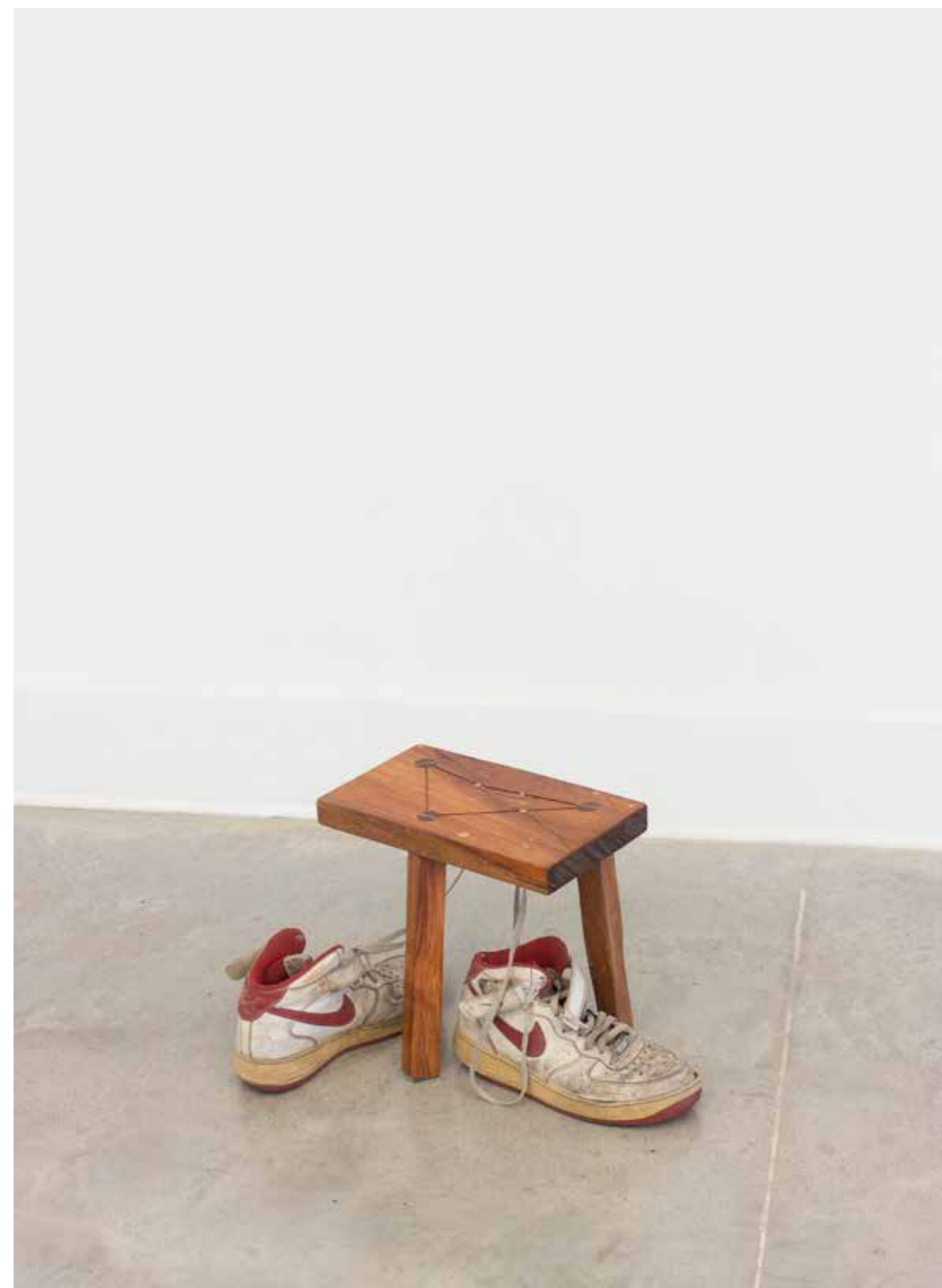
Indus — 2021-2022 Madera y objetos incrustados Medidas variables