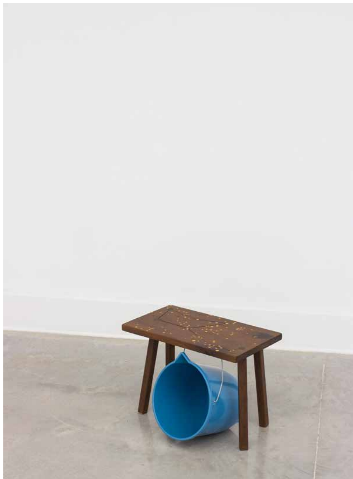
Puppis — 2021-2022 Madera y objetos incrustados 37x52x40 cm