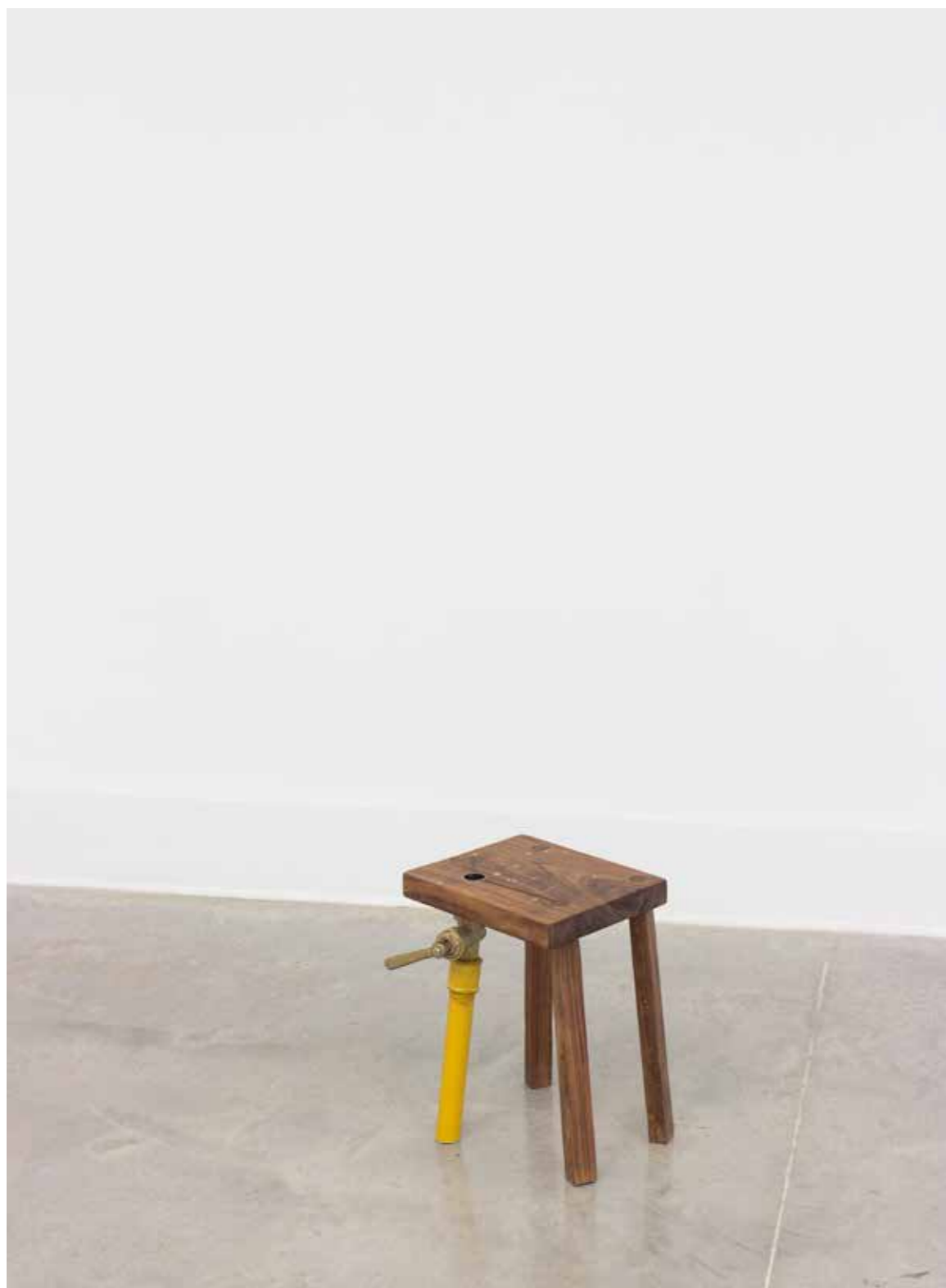
Fornax — 2021-2022 Madera y objetos incrustados 38x29x23cm