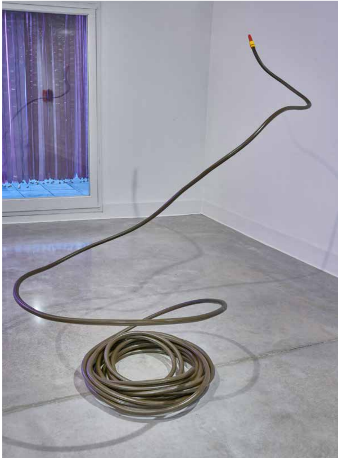
La revirada — 2021 Manguera de PVC y plástico 208x118x190 cm