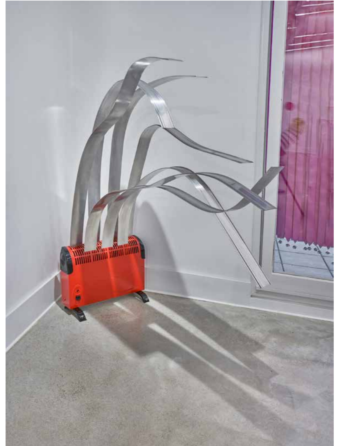
Calor específico — 2021 Hierro y aluminio 158x160x70 cm